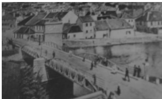
Pohled z prvních let našeho století na podklášterský železný obloukový most přes řeku Jihlavu.

O pár metrů dále byla v 90. letech vybudována železobetonová lávka plk. Svobody spojující město a Zámostí. Roku 1923 byla postavena lávka pro pěší, přes kterou se lze dostat do části nazývané Kočičina. A městskou část Nové dvory spojuje s městem Novodvorský most.