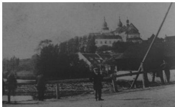
Dřevěný most vedoucí přes řeku Jihlavu na Podklášteří před rokem 1862

Třebíč je rozložena na obou březích řeky Jihlavy, která tvoří přirozenou osu města i celého třebíčského okresu. Levý a pravý břeh města spojují v centru dva mosty a dvě lávky. Nejstarší je podklášterský(Masarykův) most, který byl před rokem 1862 dřevěný. Mýtní závora most uzavírala a kdo chtěl projet, musel zaplatit. Na počátku 20. let byl most nahrazen železným a v roce 1930 – 1931 byl opět přestavěn na železobetonový do současné podoby.