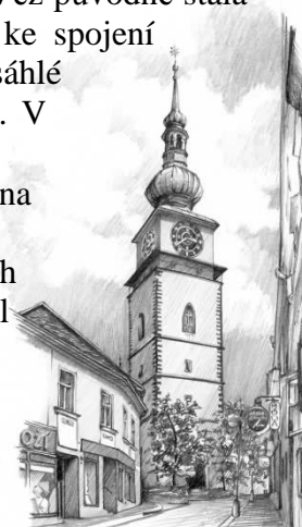
Kresba městské věže v současnosti