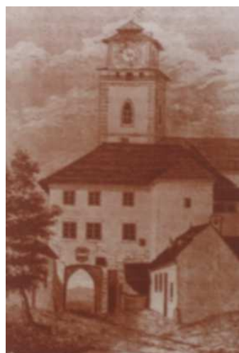
Městská věž po vyhoření v roce 1822 s nouzovou šindelovou stříškou

Nedaleko Karlova náměstí se nachází městská věž při kostele sv. Martina vznikla původně jako součást městského opevňovacího systému. Přesné datum neznáme, ale muselo to být někdy po roce 1335. První písemné zmínky o věži se dochovaly z počátku 15. století, kdy byla věž dostavena po dnešní ohoz. Vpád uherského krále Matyáše Korvína v roce 1468 znamenal pro město Třebíč pohromu a zničena byla i horní část věže. Snaha uherských vojsk o její podkopání a rozbourání však ztroskotala na pevných základech a důkladně postavených zdech. Věž původně stála zcela odděleně od kostela sv. Martina a ke spojení obou staveb došlo až v roce 1716 při rozsáhlé stavební úpravě Svatomartinského chrámu. V průběhu dalších staletí byla věž několikrát poškozena