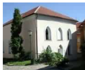
Přední synagoga na Tichém náměstí slouží dnes jako modlitebna Československé církve husitské.

Zadní synagoga se nachází na Blahoslavově ulici. Oproti většině písemných zpráv o době jejího vzniku vztahujících se k roku 1737 je třeba předpokládat, že základní hmota této stavby pochází z pozdně renesanční doby.